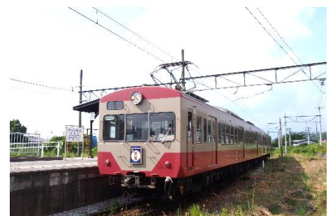
近江鉄道で運行中の「赤電」