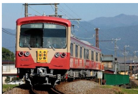
伊豆箱根鉄道で運行中の「赤電」