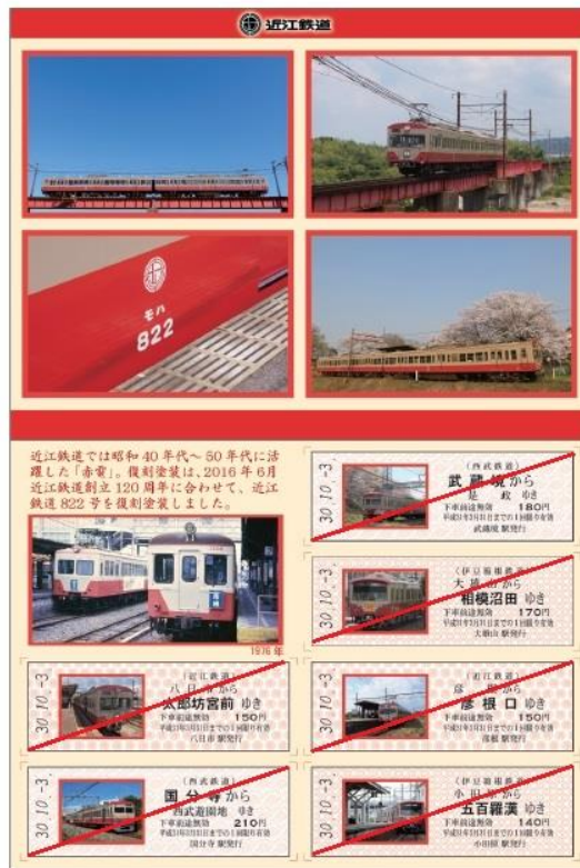
<近江鉄道バージョン>