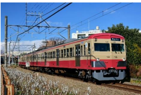
西武鉄道で運行中の「赤電」