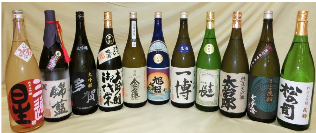
「大吟醸プレミアム電車」にて提供予定の地酒（イメージ）