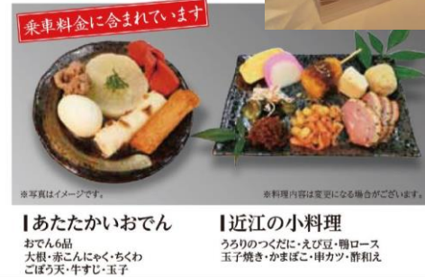
乗車料金に含まれています