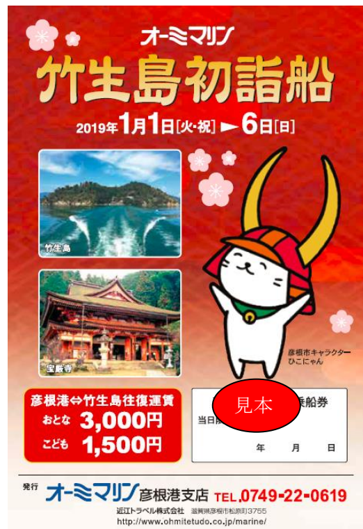
ひこにゃんイラスト入り乗船券〈見本〉