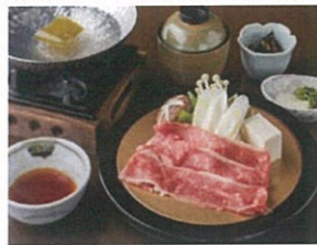
【近江牛しゃぶしゃぶ定食】