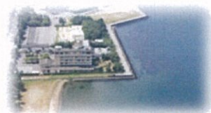
彦根港まで車で約1分