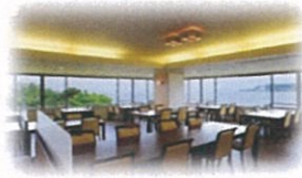
レストラン「琵琶(びわ)」