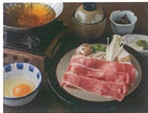
【近江牛すき焼定食】