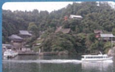
竹生島 竹生島は、琵琶湖の長浜市葛籠尾崎沖約2kmに位置し、周囲約2kmの針葉樹で覆われた島です。