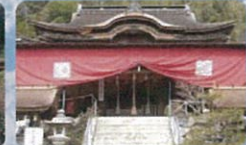
都久夫須麻神社 本殿は豊臣秀頼の命により伏見の邸舎を移築したもので、模造や天井絵なども見どころです。