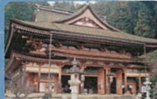
宝厳寺 西国三十三観音霊場三十番札所(札所は観音堂)で天平10年(738年)に行基が弁財天を安置したのが始まりと伝えられています。日本三大弁才天の一つ。