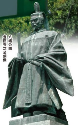
八幡公園 豊田秀次公銅像