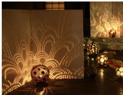
陶あかり (写真はイメージ)