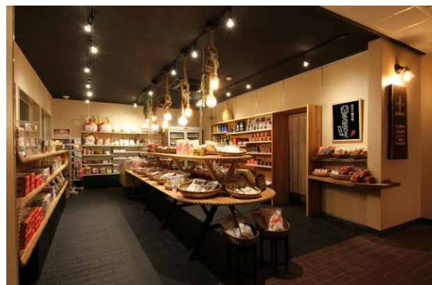
2018年3月にリニューアルされた山麓売店