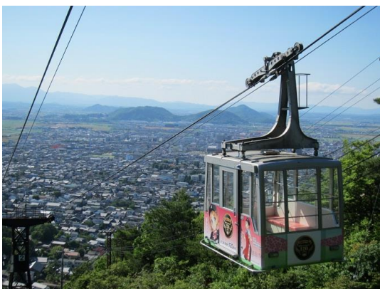
八幡山ロープウェー

http://www.ohmitetudo.co.jp/hachimanyama/shinryoku2018/index.html