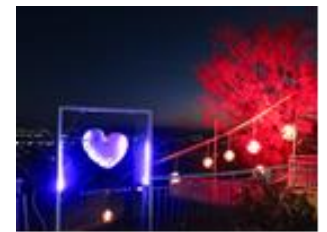
▲モニュメントイルミネーション、ライトアップ(イメージ画像)