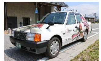
「戦国無双4」ラッピングタクシー