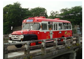
ひこにゃんラッピングボンネットバス