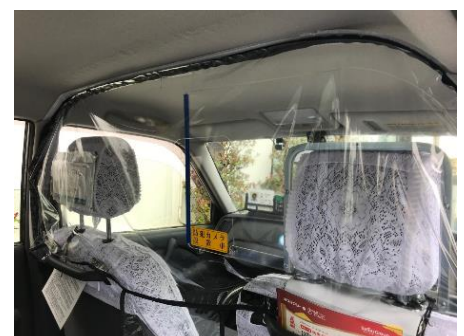
タクシー車内の飛沫感染防止カーテン