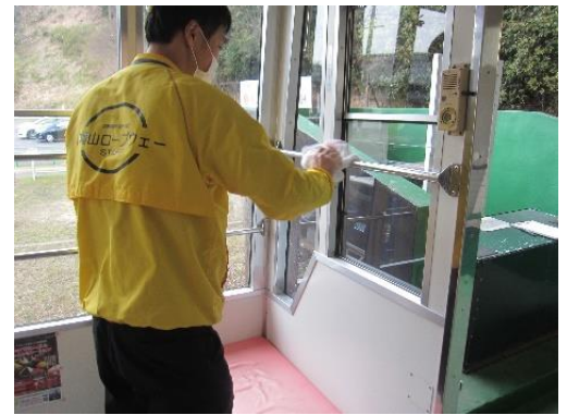
八幡山ロープウェー 搬器消毒作業の様子