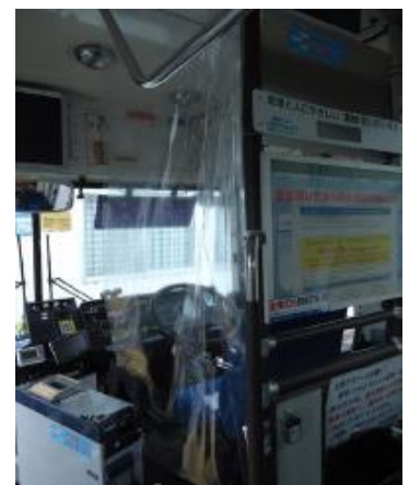
路線バス車内の飛沫感染防止カーテン