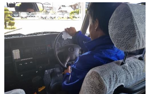
真野自動車教習所 教習車ハンドル消毒作業の様子