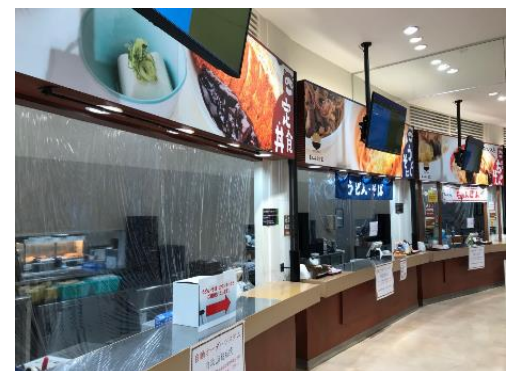
土山サービスエリア フードコート 飛沫感染防止カーテン