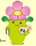
マスコットキャラクター

公園の樹木を観察し、樹木マスターになろう！ クイズシートを持って園内を巡ります。 葉、花、種、実、など毎回テーマが変わります。 年間を通して参加すると、 びぶんちゃん缶バッジが もらえます。