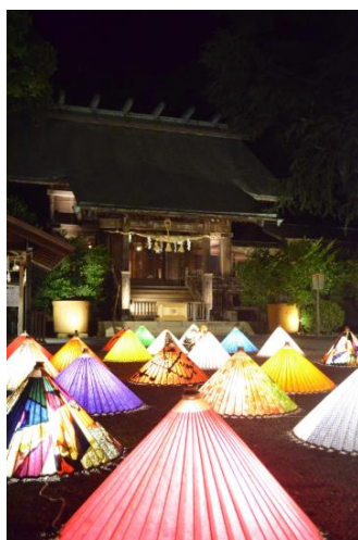
和傘のイルミネーション (イメージ)