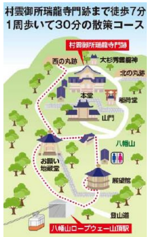
ライトアップ散策コース